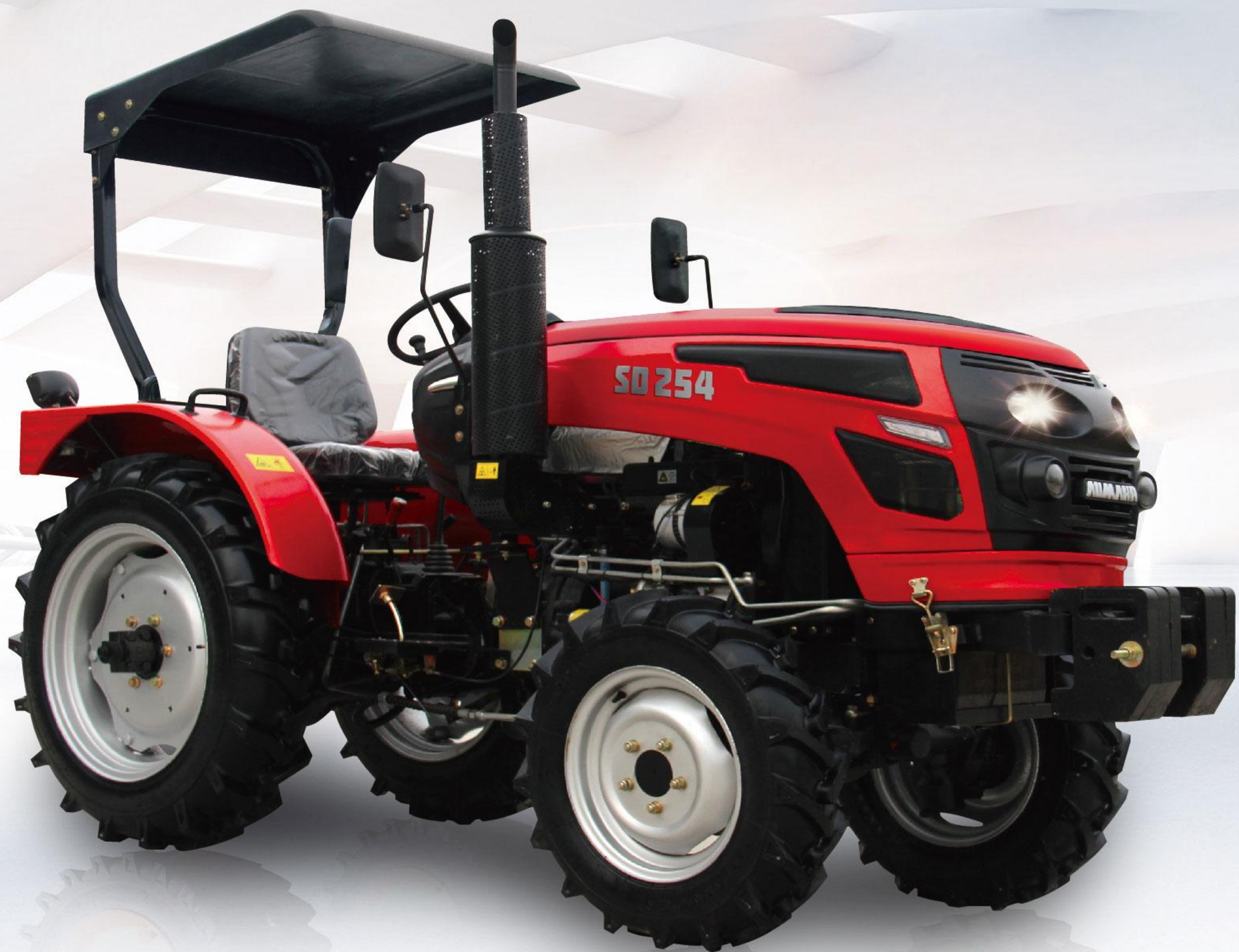
SD254/SD304/SD354 (25 马力/30 马力/35 马力) 欧马赫系列拖拉机